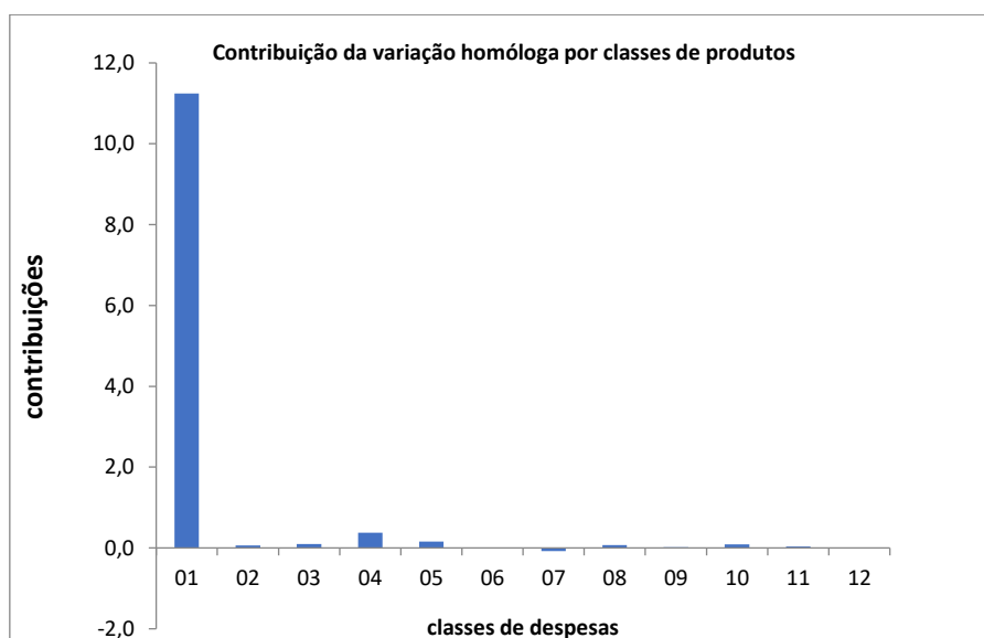
Gráfico nº2: Contribuição das classes de despesas para a variação homóloga

Para esta taxa de variação homóloga, contribuíram as seguintes funções: “Produtos Alimentares, Bebidas não Alcoólicas” (11,2%); “Habitação, Energia e Combustível” (0,4%); “Mobiliários e Artigos de Decoração” (0,2%); “Bebidas Alcoólicas” (0,1%) e “Vestuário e Calçado” (0,1%) respetivamente.